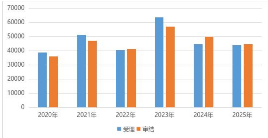
图 1：2020-2025 年上海法院一审知识产权 民事案件收结情况

(图 1)；受理一审知识产权刑事案件 698 件，审结 713 件；受理一审知识产权行政案件 16 件，审结 7 件。